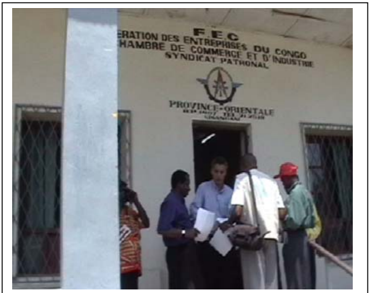
Mr MBI accorde une interview à la presse de Kisangani, après une séance de travail avec les Hommes d'affaires (FEC)...