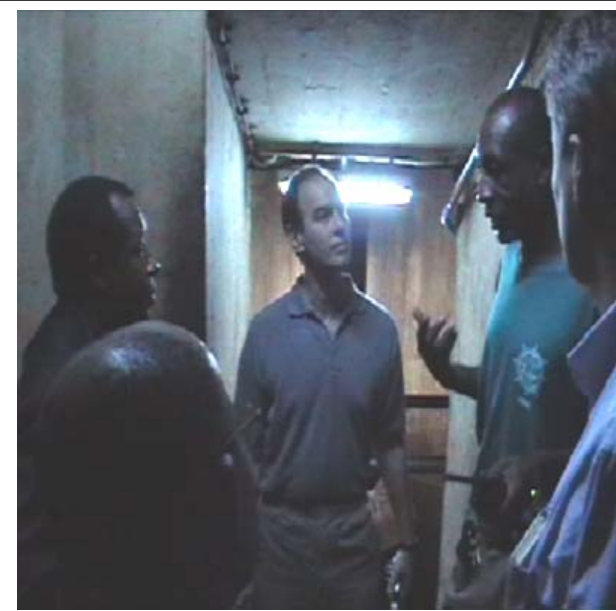
...la délégation se fait expliquer le fonctionnement du barrage de la Tshopo...