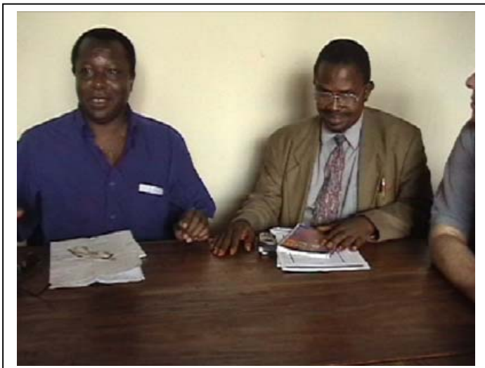
...une séance de travail avec la société civile de Kisangani...