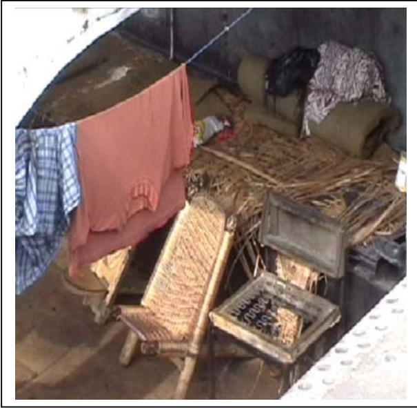
...le lit d'un passager ressemble à un nid d'oiseau...