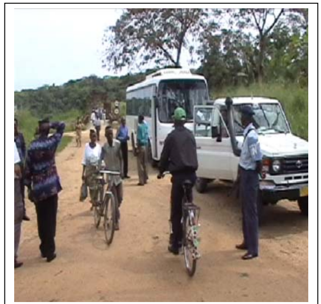
...fin de la visite du barrage hydroélectrique de la Tshopo...