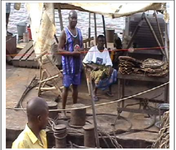
compte des conditions pénibles dans lesquelles voyagent les passagers à bord des bateaux de